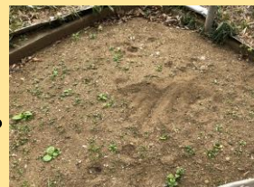
後足で地面を蹴り上げた跡

ほかにはネズミやヘビの情報も。害獣にしないための工夫、よいアイデアありませんか。