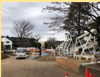
どんな遊具かな。楽しみです！

★工事中の大井庚塚公園の池上通り沿いに立っていた掲示板が大井町寄りに移動しました。ご注意ください。